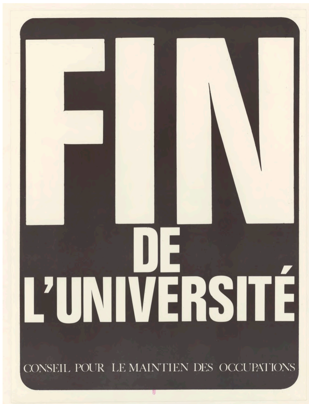
"Fin de L'Université". Fin de la Universidad. Consejo para el Mantenimiento de las Ocupaciones. Mayo del 68