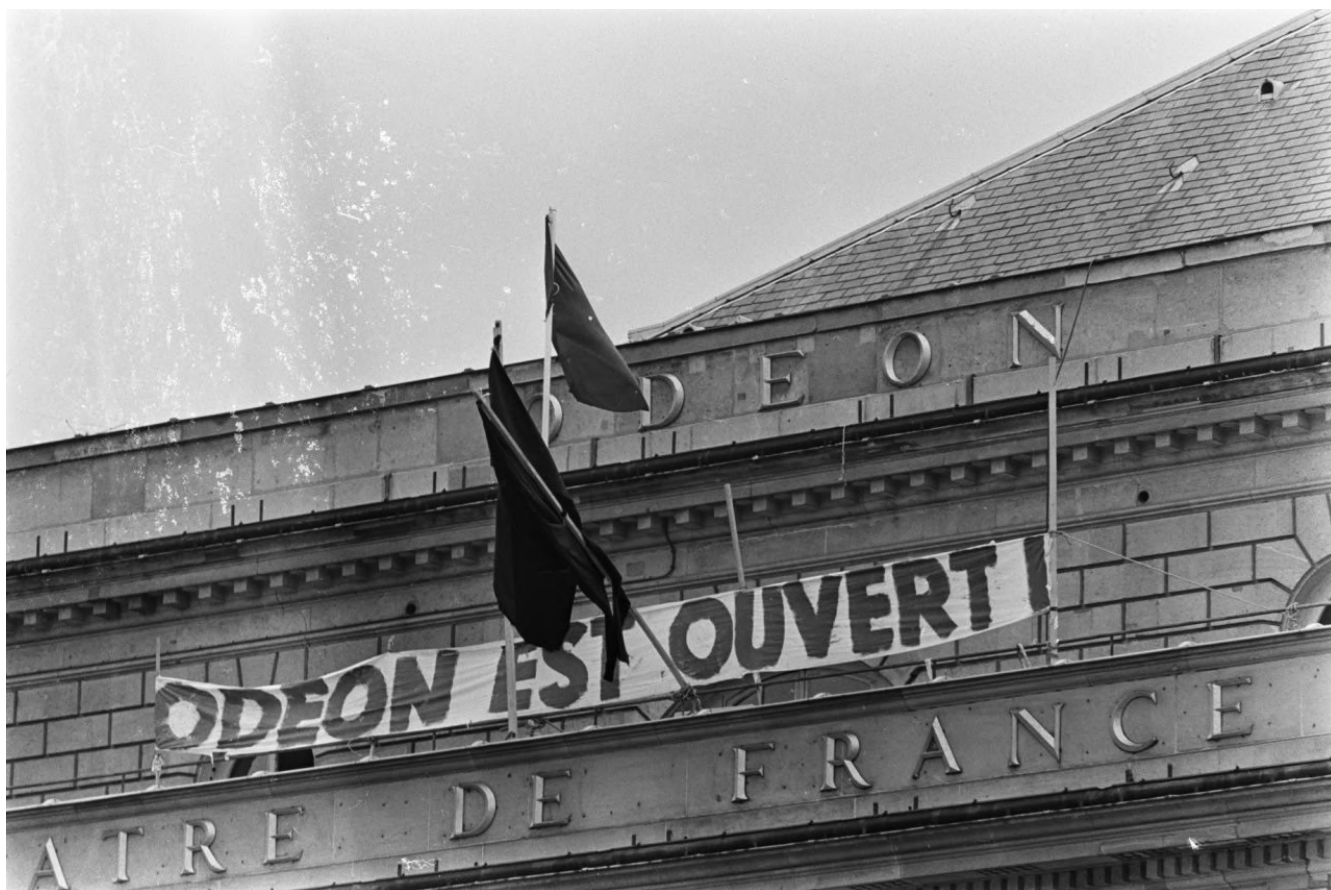
Teatro Odeon ocupado por estudiantes y artistas. Francia, Mayo del 68

de la constitución del nuevo pacto de dominio bajo hegemonía de la subfracción USA y el artículo segundo, la mimesis referida, generaron la más cruel y cruda competencia: las subfracciones dominadas, cubiertas por la sombra de la ferocidad anticomunista de los gobiernos militares, desde la indiferencia calculada garantizaron por doquier la masacre de los líderes obreros, populistas; los militares “carismáticos”, pretendientes al sin tiempo en sus gobiernos, no calcularon lo efímero en la velocidad de la masacre. Esta velocidad determinó la reconfiguración global del RPB en el predominio de lo aleatorio y lo temporal del “poder ejecutivo” y por tanto en las articulaciones del nuevo contrato de dominio y hegemonía entre las subfracciones: ¡El Derecho a la autodeterminación de las naciones naufragaba en el mar embravecido o