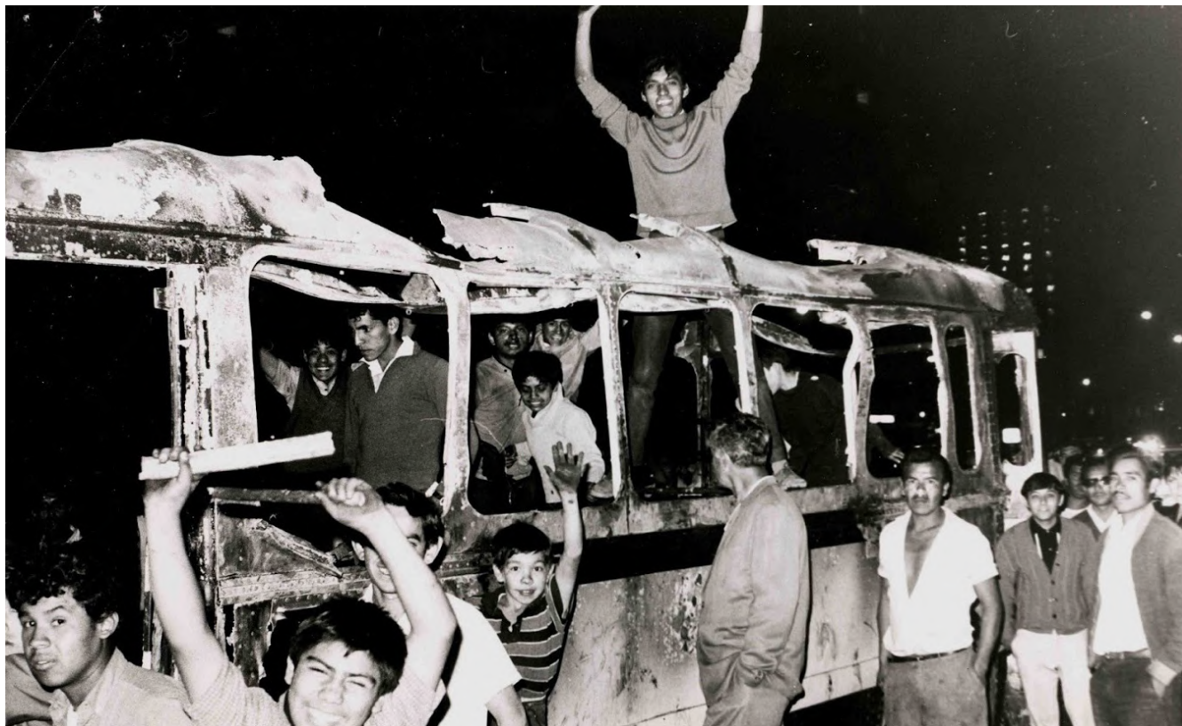
Estudiantes mexicanos en autobús quemado. México, 1968