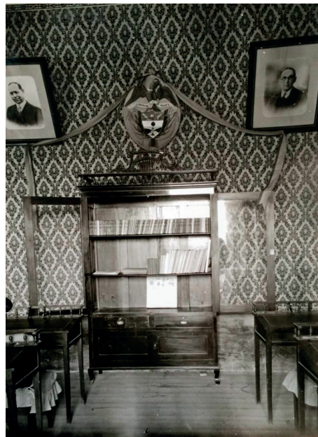
Figura 1. Biblioteca Aldeana, “Modelo”, 1936