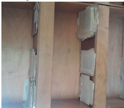
Figura 3. Información Colcultura