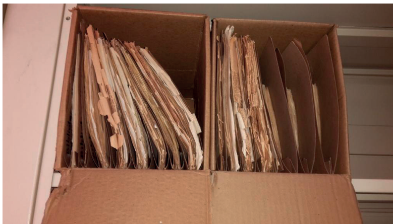
Figura 2. Información Radiodifusora H.J.N.