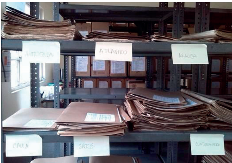
Figura 4. Clasificación expedientes Serie Comunicaciones Oficiales